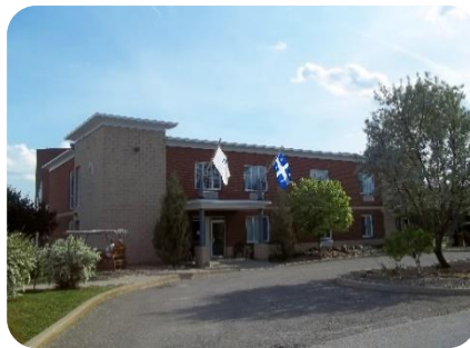
Centre régional et Hôtellerie de l'Outaouais – Pavillon Michael J. McGivney (Gatineau)