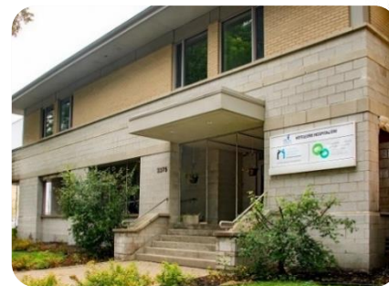
Centre régional et Hôtellerie de Québec