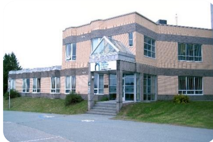
Centre régional et Hôtellerie de l'Estrie (Sherbrooke)