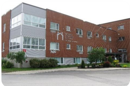
Centre régional et Hôtellerie de la Mauricie (Trois-Rivières)