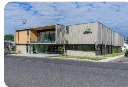
Centre régional et Hôtellerie de Lévis – Maison Dessercom