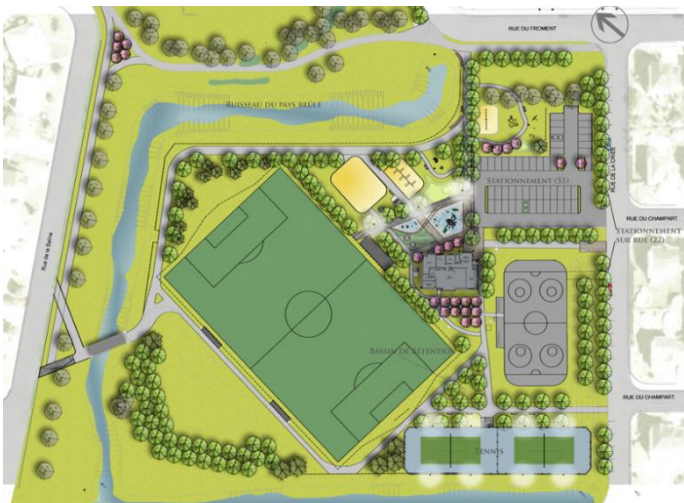
Figure 3. Parc du Portageur, activités variées, Varennes