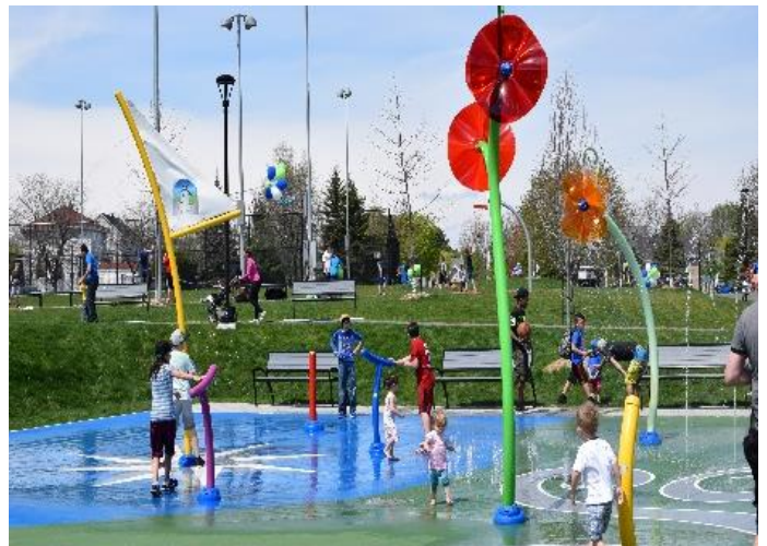
Figure 4. Parc des Éperviers, jeux d'eau, Notre-Dame-de-l'Île-Perrot