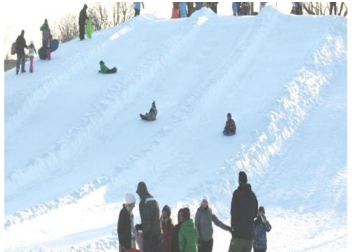
Figure 2. Parc du Petit-Rapide, pente à glisser, Beloeil