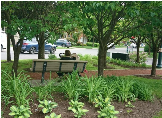
Figure 1. Place Cartier, mini-parc, Saint-Lambert