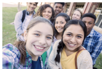
Les jeunes au cœur de nos actions

Soutenir les jeunes sans jugement et dans le respect de la diversité