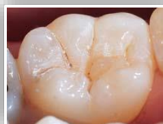
Dent non scellée